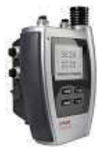
データロガー HL-NTシリーズ