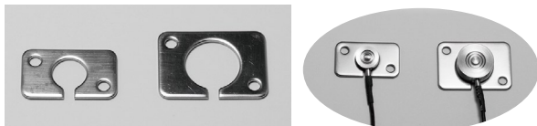
取付ホルダ(付属品)