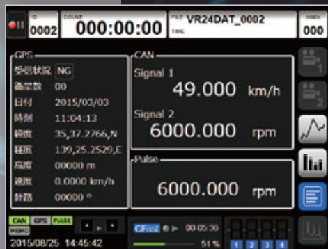
CAN・GPS・パルス表示画面