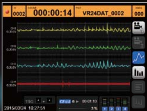
データレベルを波形で表示