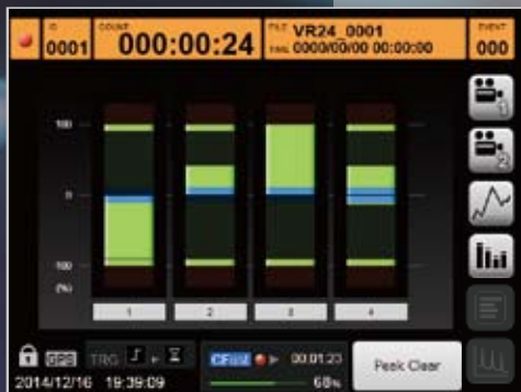
データレベルをバーメーターで表示