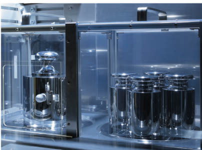
JCSSを始めとする 各種の技術要求に対応する設備