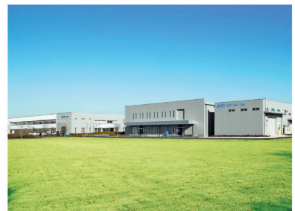
校正が行なわれる開発・技術センター