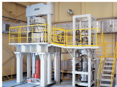
国内最大で圧縮力10MNまでの校正が可能な 特定二次標準器